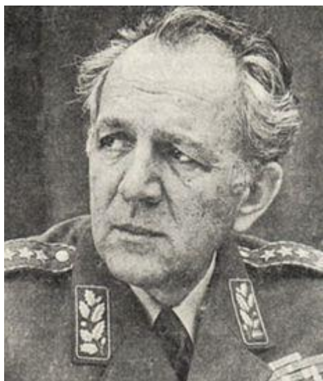
oko Jovani general JNA